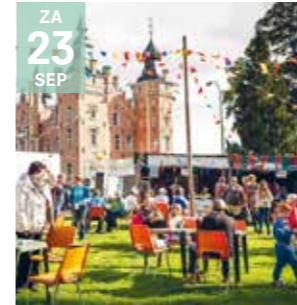
EVENT DAG VAN DE DILBEKENAAR

Samen genieten van Dilbeekse producten, het grootste terras en meedoen met heel wat animatie.