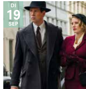
FILM THE ZOOKEEPERS WIFE Niki Caro

Waargebeurd en persoonlijk oorlogsverhaal waarin hoop centraal staat met Johan Heldenbergh.