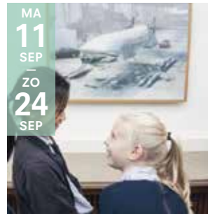
FAMILIE - EXPO RASA Inspiratie (8+)

Je ontdekt hoe het werk van kunstenaars Panamarenko, Luc Tuymans en Jan Fabre door hun jeugdijaren is beïnvloed.