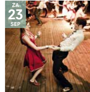
EVENT - DANS SEIZOENSOPENING met Radio Modern

We dansen en stampen het nieuwe cultuurseizoen uit de grond, compleet in jaren '50 stijl.