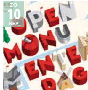
EVENT OPEN MONUMENTEN-DAG

Een ontbijt, een wandeling en een ontdekking. Voor kinderen is er een zoektocht en een photobooth.