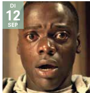
FILM GET OUT Jordan Peele

Slim gemaakt en relevant in tijden van Black Lives Matter .