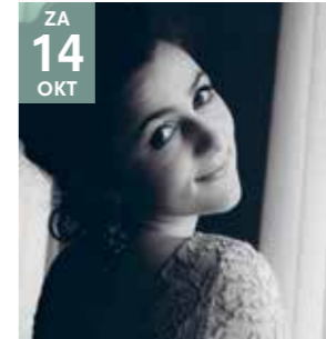
KLASSIEK - CULTUUR OVERDAG OPERA AVANTI Weense operette gala

Solisten brengen de mooiste Weense operettemelodieën n.a.v. 100 jaar Koninklijke Toneelkring De Bietjes.