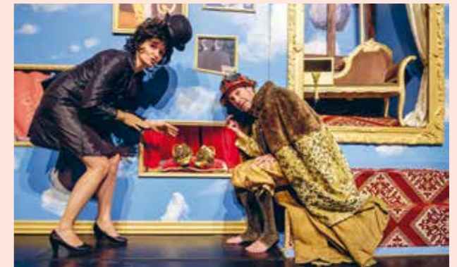
De Koning Zonder Schoenen (3+)