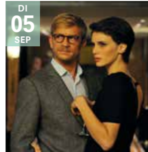
FILM L'AMANT DOUBLE François Ozon

Psycho-erotische thriller over een depressieve vrouw die verliefd wordt op haar psychiater.