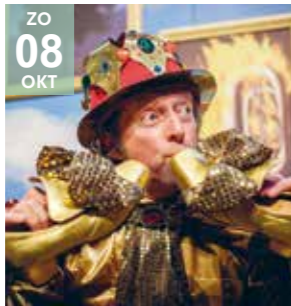
FAMILIE - THEATER 4HOOG De Koning Zonder Schoenen (3+)

Een royale voorstelling over verdriet, hoop en geluk.