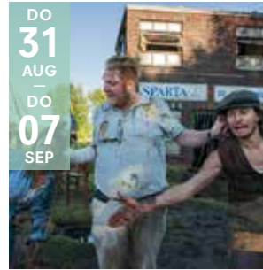
FAMILIE - THEATER UITVERKOCHT STUDIO ORKA Chasse Patate i.h.k.v. Het Theaterfestival

Chasse Patate gaat over veerkracht, over iets écht willen en niet opgeven. Over dromers, vechters en veel te warm bier.