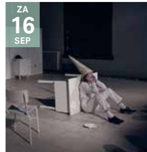
THEATER - MUZIEK FRIS FRIS kiest FAUST, EEN MECHANISCHE KOMEDIE

Een zoektocht naar 'het Woord' in een toverkelder vol magische ongeloofwaardigheden en grammaticale verwarringen. Met afterparty.