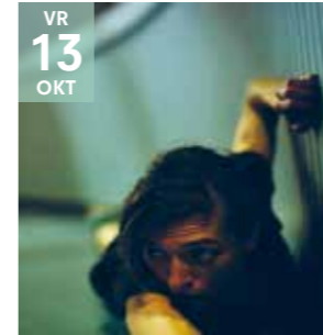
THEATER TG STAN Alleen

Een ode aan samenleven met elkaar en het bewijs dat zelfs de grootste verschillen bedekt kunnen worden met de djellaba der liefde.