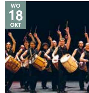
DANS CHE MALAMBO (Argentinië)

Spectaculair voetenwerk, bombo-drums, krachtige zang en sensationele lasso-acts.