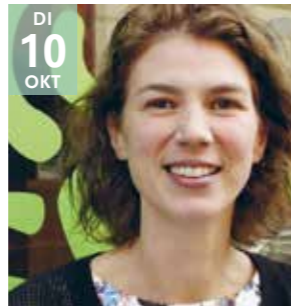
LEZING - CULTUUR OVERDAG B. HERREMANS Een onmogelijke vrede in Israël en Palestina?

In Palestina is een groot draagvlak voor vreedzaam verzet dat ook wordt gevoed door Israëlische mensenrechten- en vredesactivisten.