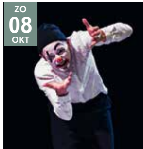
FAMILIE - THEATER 4HOOG Een Pippo (6+)

EXTRA VOORSTELLING! 19:30 - VR 13.10 Castelhof