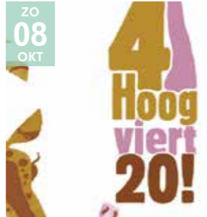
FAMILIE - FESTIVAL 4HOOG 4viert20 (3+)

4Hoog is jarig! Ze trakteren met drie theatervoorstellingen en feestelijke activiteiten.