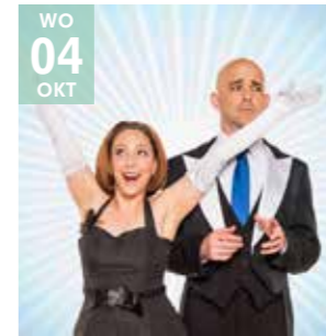
HUMOR STRANGE COMEDY (VK/VS) De Show

Over de hele wereld gekend voor visuele illusies, verrassende acrobatie en bovenal hilarische clownerie.