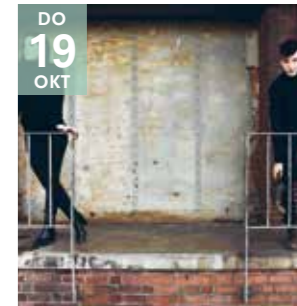
THEATER COLLECTIEF DOFT Tweestrijd

In deze voorstelling interageren twee personen met elkaar alsof ze de wedstrijd van hun leven spelen.