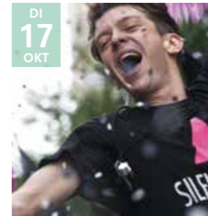
FILM 120 BATTEMENTS PAR MINUTE Robin Campillo

Winnaar van de Grote prijs van de jury op het filmfestival van Cannes.