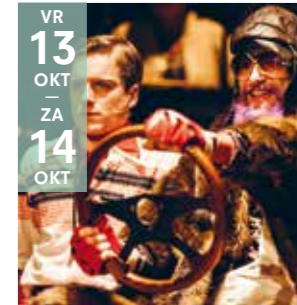
FAMILIE - MUZIEKTHEATER LAIKA / HET NIEUWSTEDELIJK Zigzagkind (10+)

Het razend spannende verhaal over de grote levensvragen van een jongere op de rand van de volwassenheid.