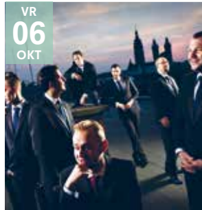
KLASSIEK GENTLEMEN SINGERS (Tsjechië)

Dit mannenoctet brengt een uniek repertoire van werken variërend van Oude Muziek tot eigentijdse popmuziek.