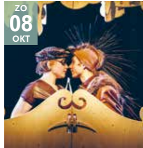
FAMILIE - THEATER 4HOOG Stekeblind (3+)

De (onmogelijke) liefde tussen Egel en Mol. Stekeblind is een verhaal van liefde, een Romeo en Julia voor kleuters.