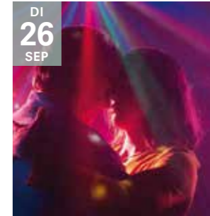
FILM UNA MUJER FANTASTICA Sebastian Lelio

Winnaar van de Zilveren Beer voor Beste Scenario op het filmfestival van Berlijn.