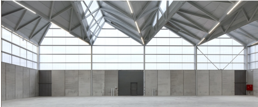
Bovenlichten, herhaling en vouwwerk: de sterktes van het loodsgebouw.